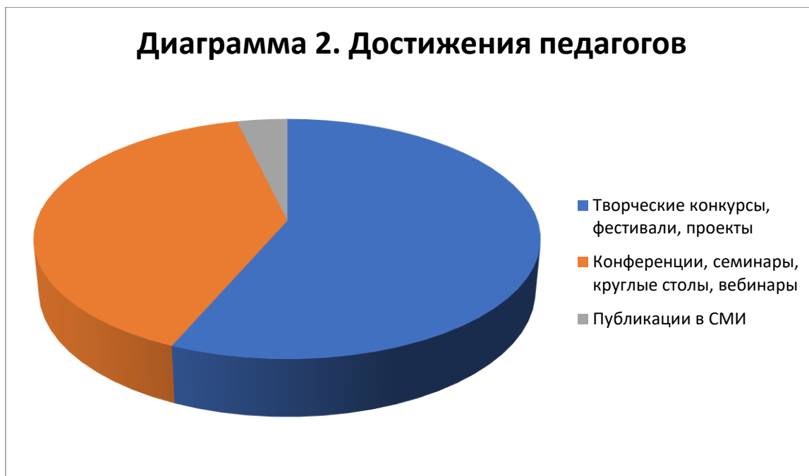
Диаграмма 2. Достижения педагогов